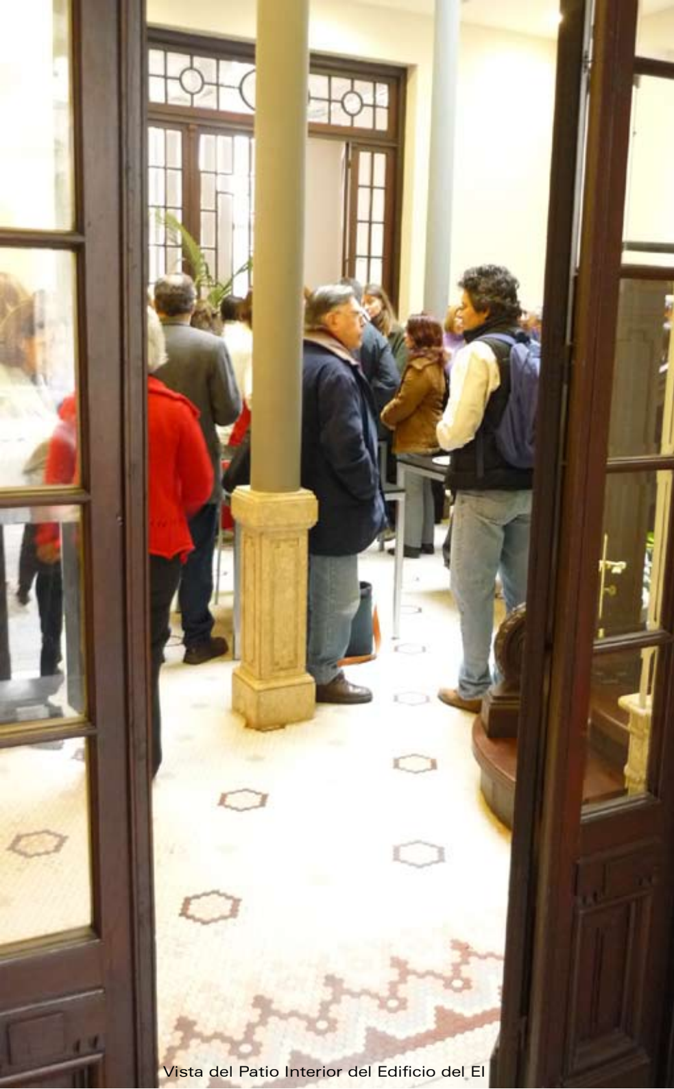
Vista del Patio Interior del Edificio del El