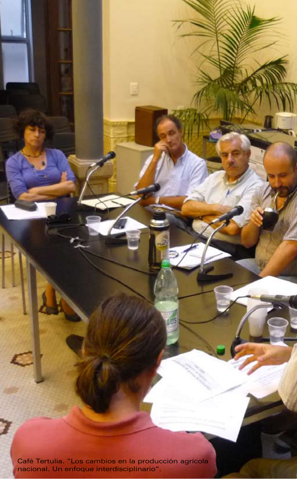
Café Tertulia. "Los cambios en la producción agrícola nacional. Un enfoque interdisciplinario".